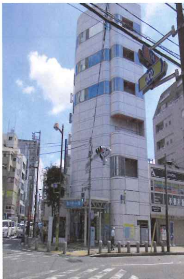
サポートセンター外観

開所日 月曜日～金曜日（祝祭日及び年末年始等を除く） 開所時間 午前10時 ～ 午後4時 住所 千葉県市川市八幡2丁目4番8号 旧八幡市民談話室4階 電話（ファックス） 047-704-8993