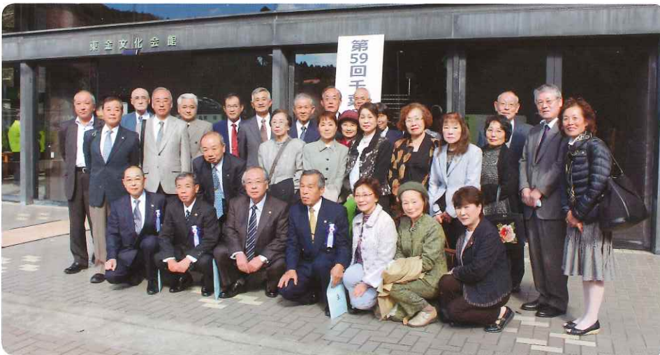
平成27年11月19日:東金文化会館