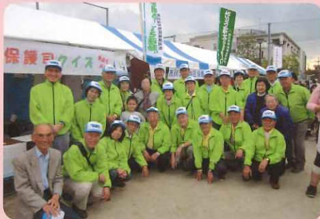
平成27年11月7日 大洲防災公園

犯罪や非行のない社会を目指して、ポケットティッシュの配布等、関係諸団体とともにキャンペーンを行いました。クイズやゲームも実施し、保護司について周知することができました。