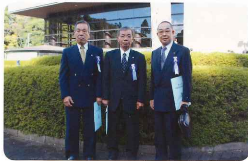
法務大臣表彰を受彰された皆さん