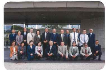
平成27年9月18日 宮城刑務所