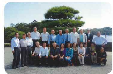
松島フェリー乗り場前